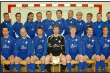
Víðisliðið sem fór til Frakklands.

Enn hefur íslensku liði ekki tekist að sigra leik í Futsal Cup og því gaman að sjá hvort Keflvíkingum tekst að þoka Íslandi upp styrkleikalistann í Futsal, en við erum mjög nedarlega þar. Víðir lenti á móti liðum frá Armeníu, Frakklandi og Kýpur en Hvöt lék gegn liðum frá Austurríki, Ísrael og Armeníu. Keflvíkingar drógust með liðum frá Frakklandi, Hollandi og Svíþjóð. Þau lið eru öll töluvert hærri en Keflavík á styrkleikalista UEFA.