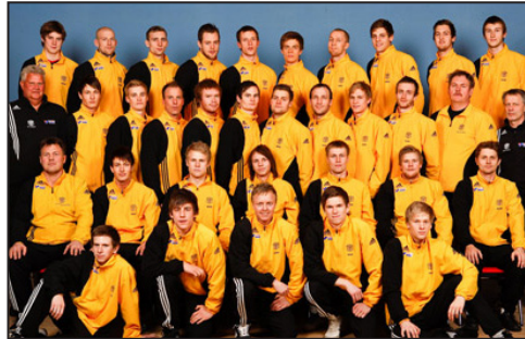
Lið Vimmerby IF fyrir ofan og Club Futsal Eindhoven fyrir neðan