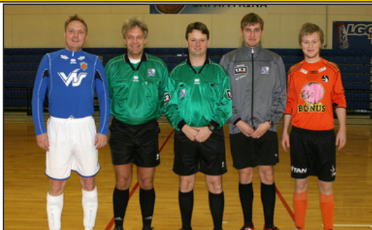
Dómarar og leikmenn í fyrsta opinbera Futsal leiknum sem fór fram hér á landi

gáfu þeir ekki kost á sér í Futsal Cup og þar